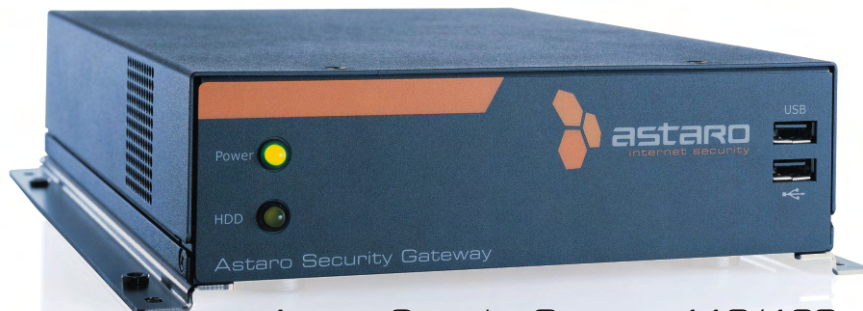
Astaro Security Gateway 110/120